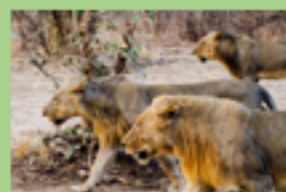
Ginger le roi de la Luangwa détrôné sous nos yeux par 3 jeunes mâles ambitieux. La fin d'un règne !