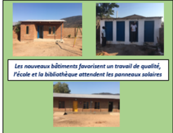
Les nouveaux bâtiments favorisent un travail de qualité, l'école et la bibliothèque attendent les panneaux solaires

Sont actuellement en chantier, l'enduit des clôtures extérieures pour solidifier l'ouvrage et un bâtiment pour stocker les aliments des volailles et les outils du jardinier