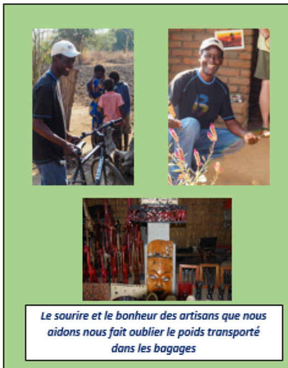
Le sourire et le bonheur des artisans que nous aidons nous fait oublier le poids transporté dans les bagages

Outre l'achat d'artisanat que nous proposons à la vente lors de l'Assemblée Générale nous avons apporté des vélos (pour le transport) et des outils à bois (pour les travaux de sculpture)