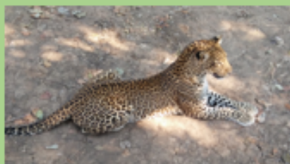
La vallée de la Luangwa est surnommée, à juste titre, la vallée des Léopards