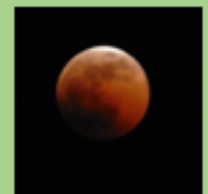
Les bagages à l'aller comme au retour ont du mal à trouver leur place. L'éclipse de lune dans le ciel austral