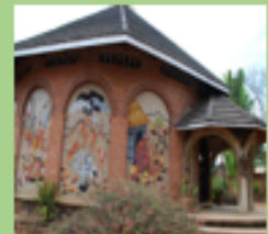
A côté de MUA MISSION et de son église le Centre Culturel et le Musée des civilisations CHEWA